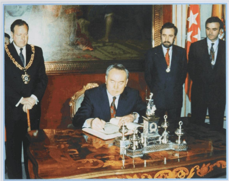
На торжественной встрече в мэрии для вручения «золотых ключей» от Мадрида, 24 марта 1994 г.