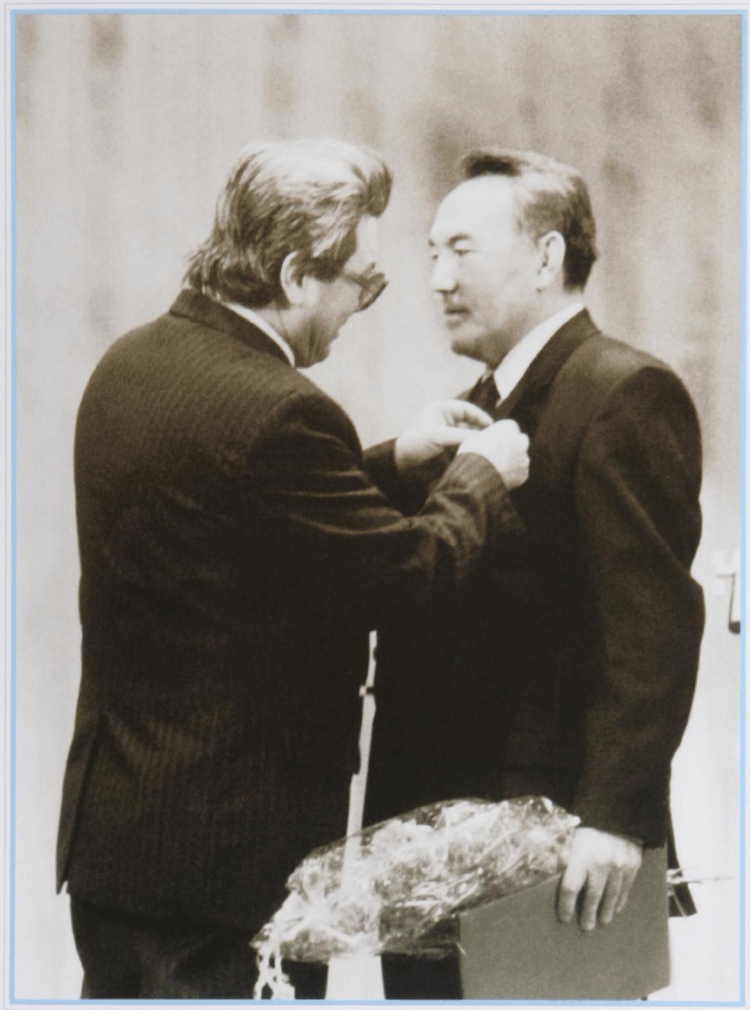
Присвоение звания «Человек года» Международной ассоциацией содействия возрождению духовности «Руханият». Бишкек, 3 декабря 1993 г.