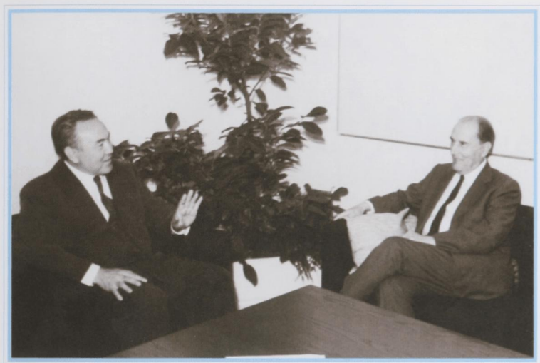
Встреча с патриархом европейской политики, президентом Франции Ф. Миттераном. Париж, февраль 1994 г.