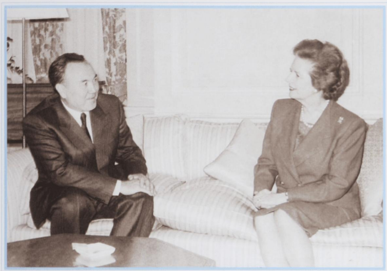
Встреча с премьер-министром М. Тэтчер. Алматы, август 1991 г.