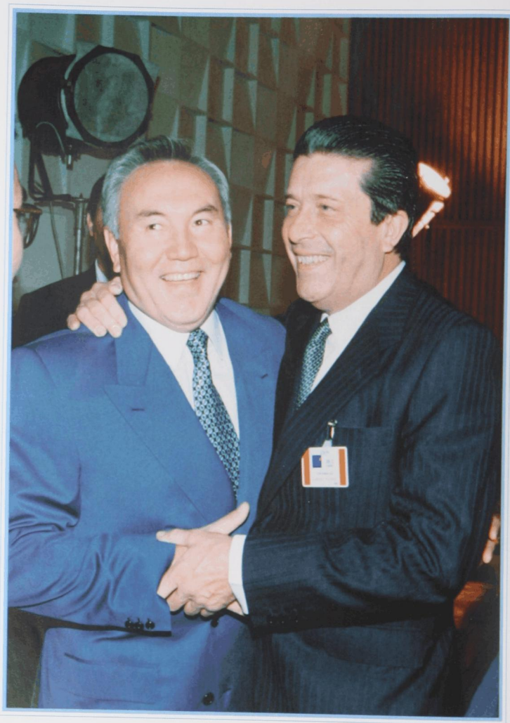
Вручение Президентской премии мира и духовного согласия генеральному директору ЮНЕСКО Ф. Майору. Париж, ноябрь 1995 г.