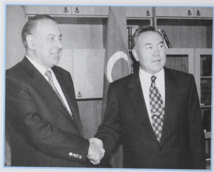
С президентом Азербайджана Г. Алиевым.