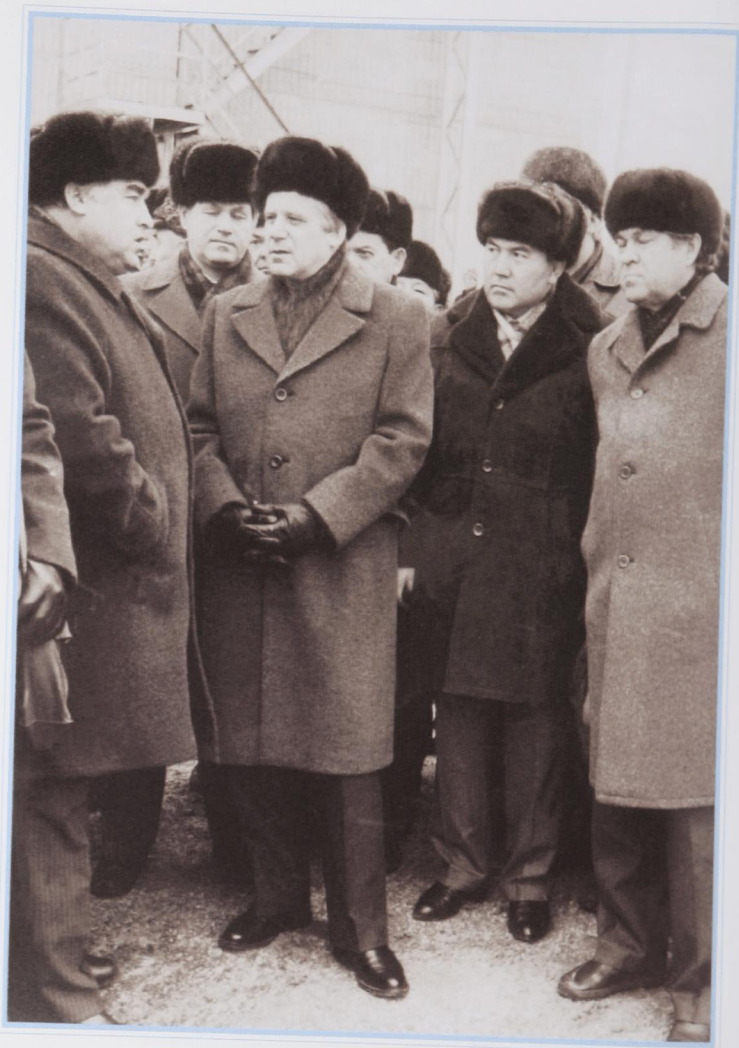
С Н. Рыжковым в Карачаганаке, декабрь 1986 г.