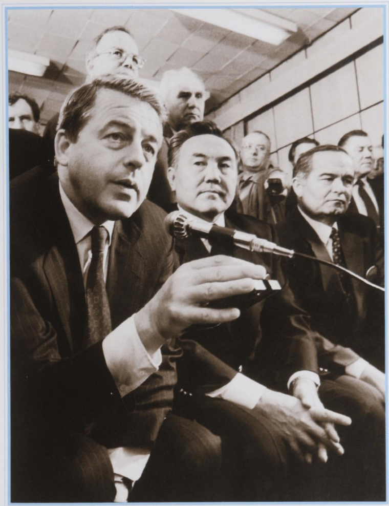
Перед стартом международного экипажа «Союз ТМ-13». Байконур, октябрь 1991 г.

Литературный отдел ЦСР © 1991 журнал «Взгляд»