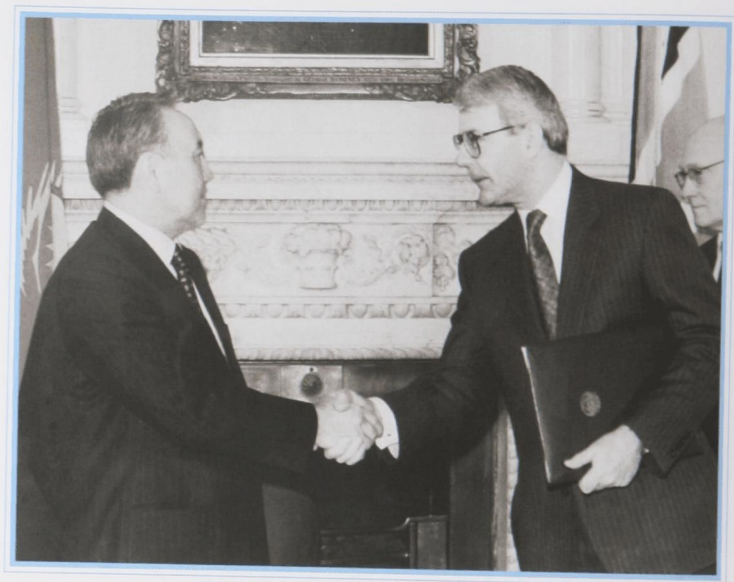
Даунинг стрит, 10. С премьер-министром Великобритании Дж. Мейджором, март 1994 г.