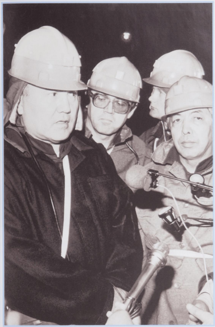
Среди жезказганских шахтеров.