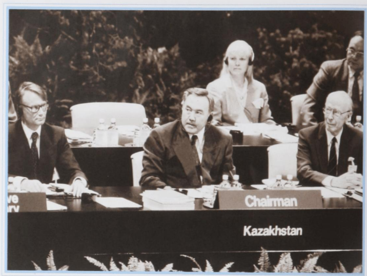
Конференция по безопасности и сотрудничеству в Европе. Хельсинки, июль 1992 г.