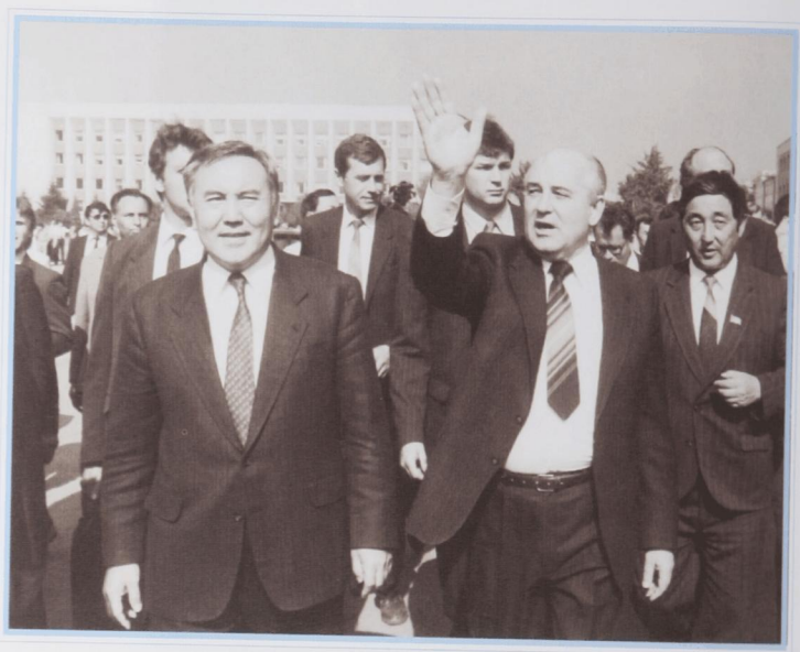
С М. Горбачевым в Кокшетау, май 1991 г.