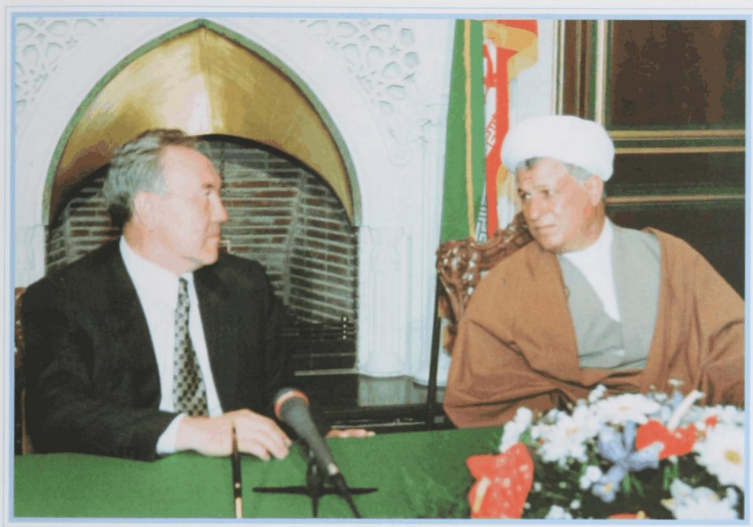
Президент Ирана А. А. Хашеми-Рафсанджани в Казахстане. Алматы, октябрь 1993 г.