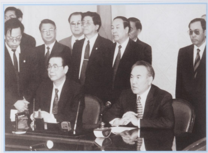
С премьером Госсовета КНР Ли Пэном. Алматы, апрель 1994 г.