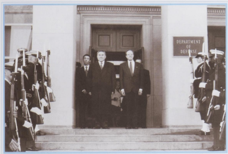
Встреча с У. Перри в Пентагоне. Вашингтон, февраль 1994 г.