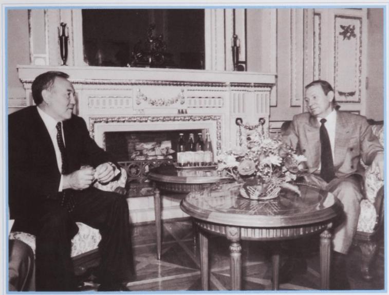
С президентом Украины Л. Кучмой.