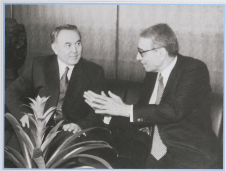
Беседа с генеральным секретарем ООН Б. Гали. Нью-Йорк, октябрь 1992 г.