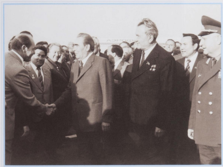
Приезд Л. И. Брежнева на 60-летие образования Казахской ССР. Алма-Ата, август 1980 г.