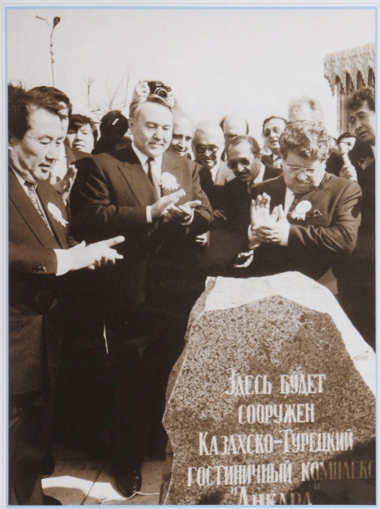
Президент Турции Т. Озал на месте сооружения отеля «Анкара». Алматы, апрель 1993 г.