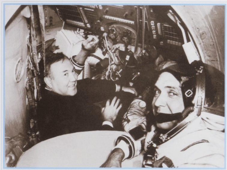
В кабине космического корабля. Звездный городок, 1991 г.