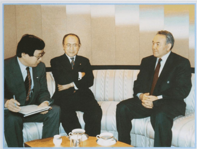
С предпринимателями Японии. Токио, май 1994 г.