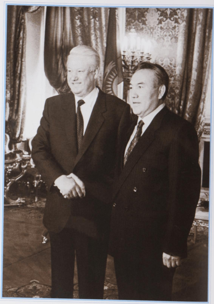
В Кремле с президентом России Б. Ельциным.