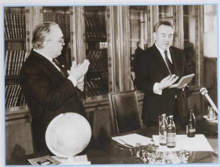
В Московском университете, март 1994 г.