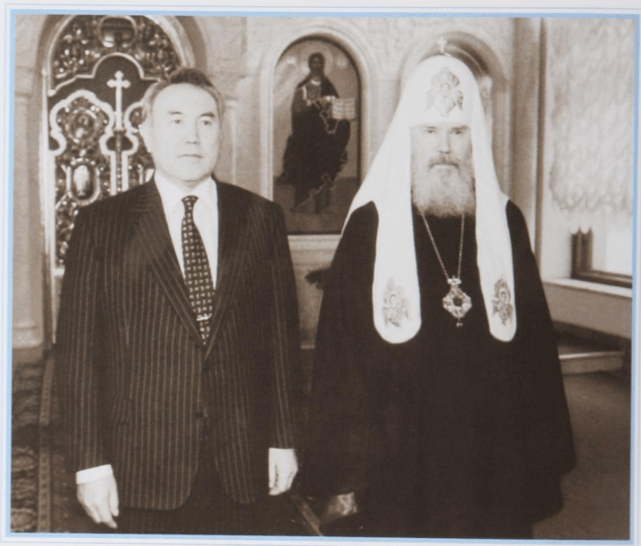
Со Святейшим Патриархом Московским и Всея Руси Алексием II. Алматы, июнь 1995 г.