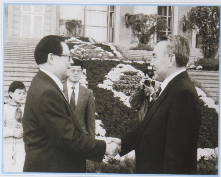
Беседа с председателем КНР Цзян Цзэмином. Пекин, сентябрь 1995 г.