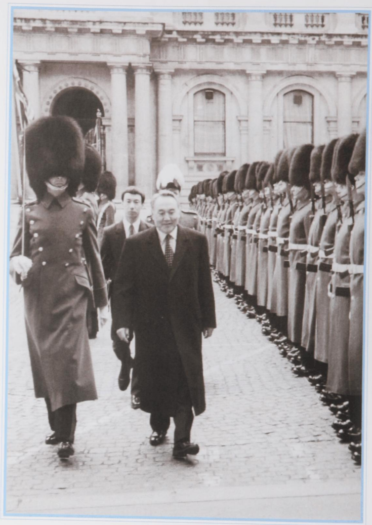
Официальная церемония в Вестминстере. Лондон, март 1994 г.