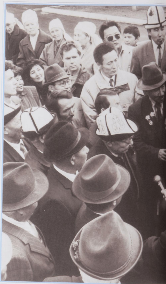
В родном ауле.