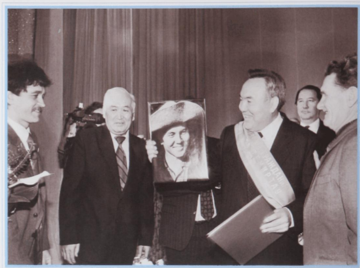
Снова там, где начиналась трудовая биография. Встреча с металлургами Темиртау.