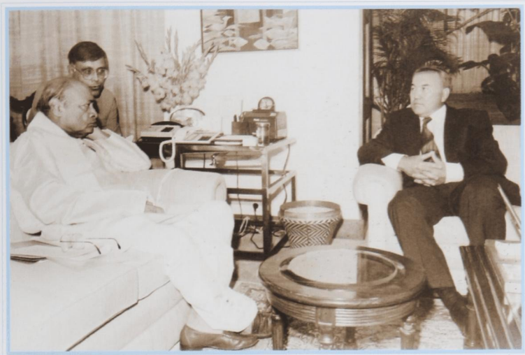
С премьер-министром Индии П. В. Нарасимха-Рао. Дели, февраль 1992 г.