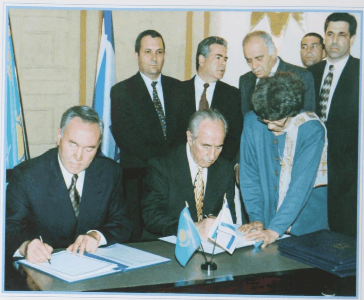
Подписание казахстанско-израильских соглашений с премьер-министром Израиля Ш. Пересом, декабрь 1995 г.