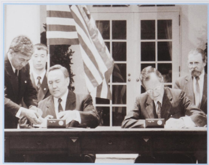
С президентом США Дж. Бушем, май 1992 г.