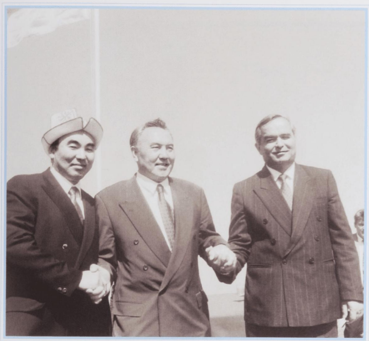
Единство трех народов. Ордабасы, май 1993 г.