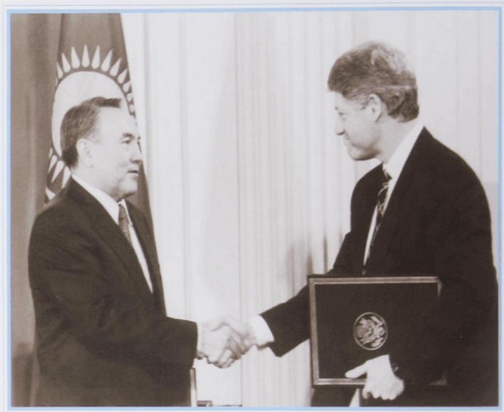
Подписание двухсторонних документов с президентом США У. Клинтон. Вашингтон, февраль 1994 г.