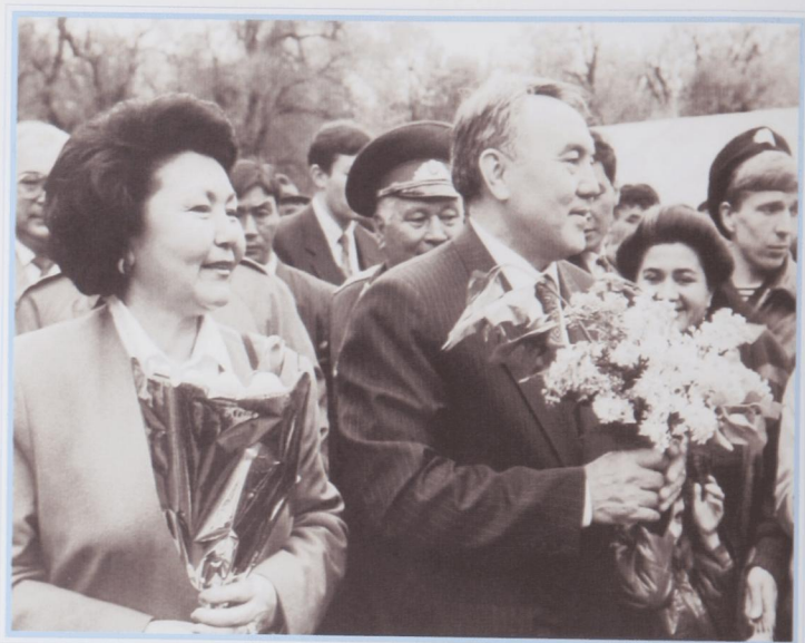
На праздновании Наурыза.