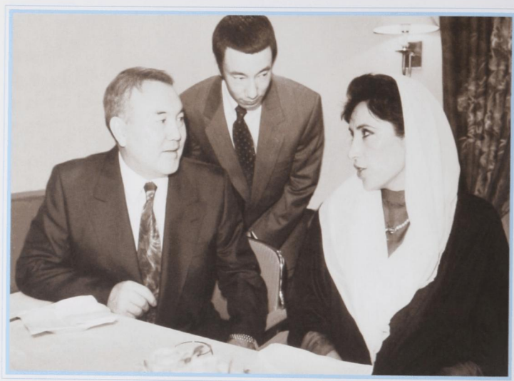
С премьер-министром Пакистана Б. Бхутто. Алматы, август 1995 г.