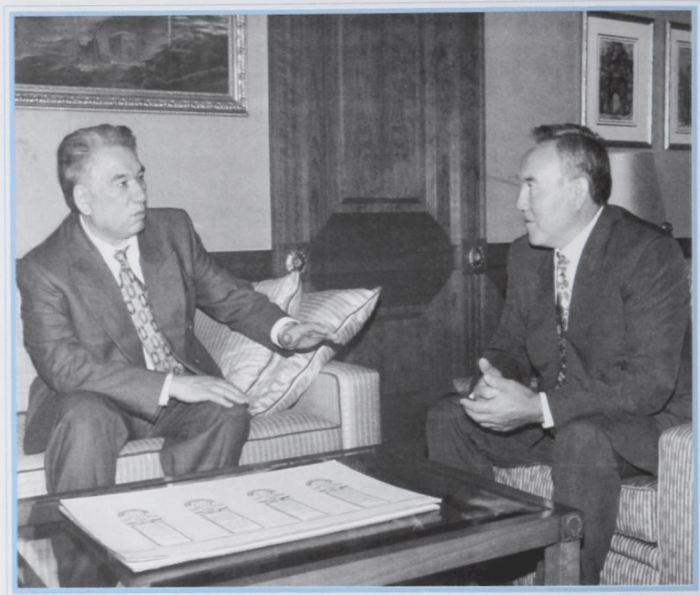
Вручение Президентской премии мира и духовного согласия 1993 года Ч. Т. Айтматову. Алматы, декабрь 1993 г.