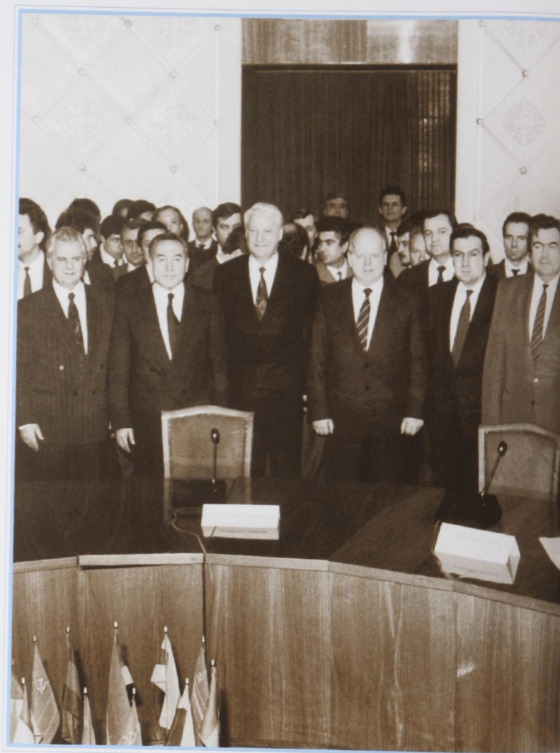
Первый саммит глав государств СНГ в Казахстане. Алматы, декабрь 1991 г.