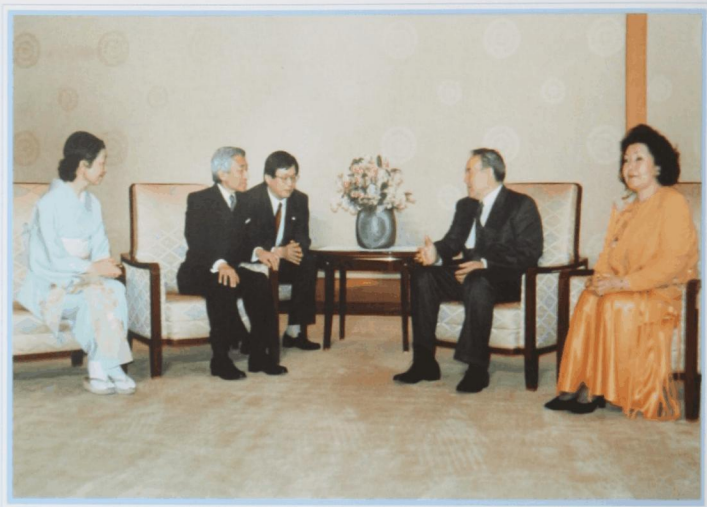
В месяц цветения сакуры. Беседа с императором Акихито. Токио, апрель 1994 г.