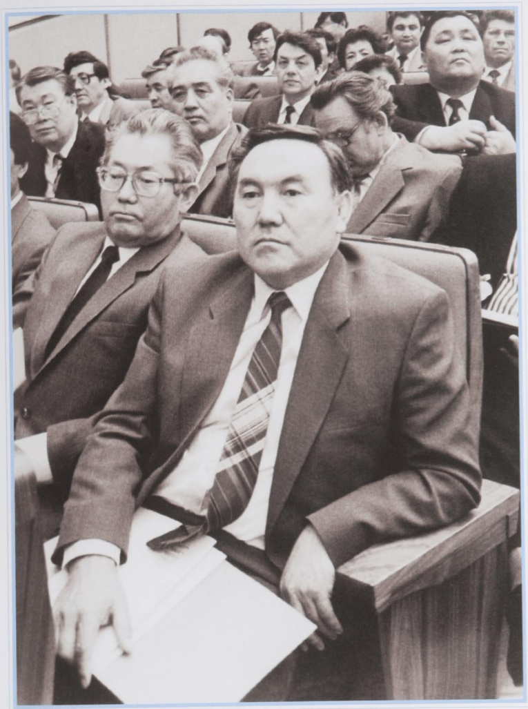
На I Съезде народных депутатов СССР.