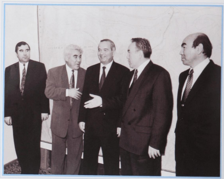
Конференция глав государств центральноазиатского региона. Нукус, январь 1994 г.