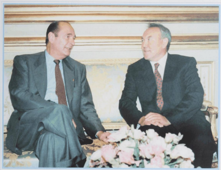
С президентом Франции Ж. Шираком. Париж, октябрь 1995 г.