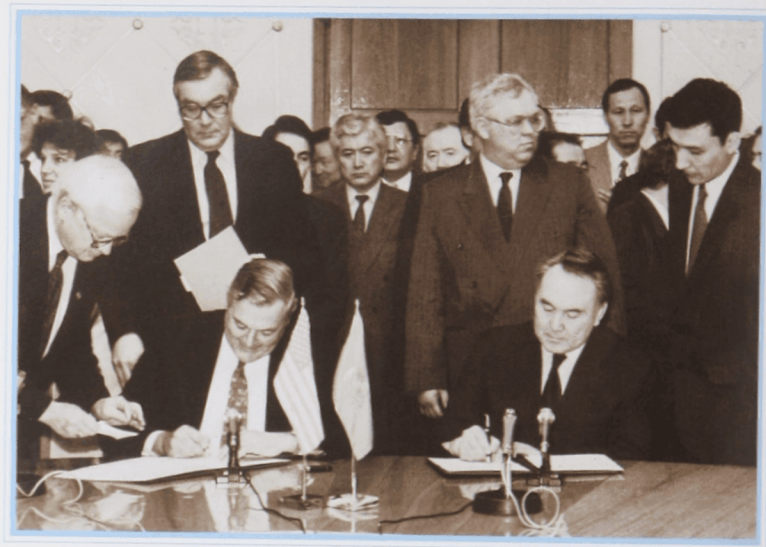
Подписание меморандума о создании совместного предприятия «Тенгизшевройл» с председателем правления, директором-распорядителем корпорации «Шеврон» Кеннетом Т. Дерром. Алматы, апрель 1993 г.