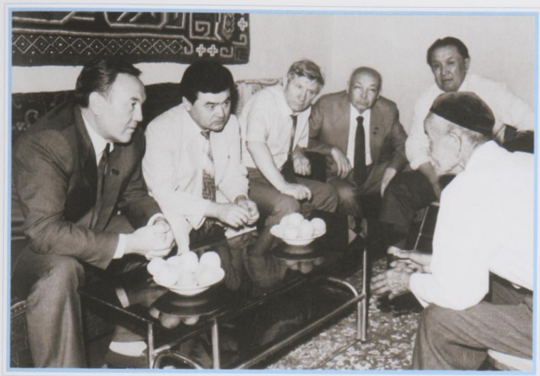
В казахской семье. СУАР КНР, июль 1991 г.