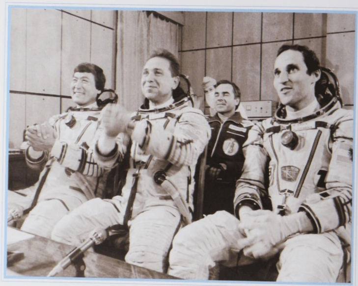
Командир корабля А.А. Волков, космонавты-исследователи Т.О. Аубакиров и Франц Фибек.