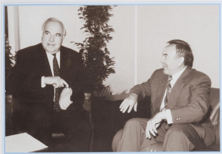
Встреча с канцлером ФРГ Г. Кодем. Бонн, сентябрь 1992 г.