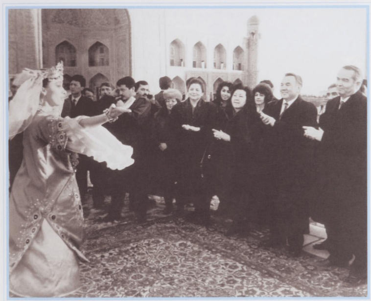
Посещение Самарканда, январь 1994 г.