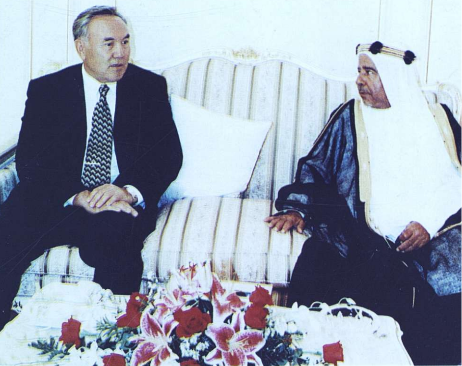
ВСТРЕЧА С ЭМИРОМ БАХРЕЙНА.