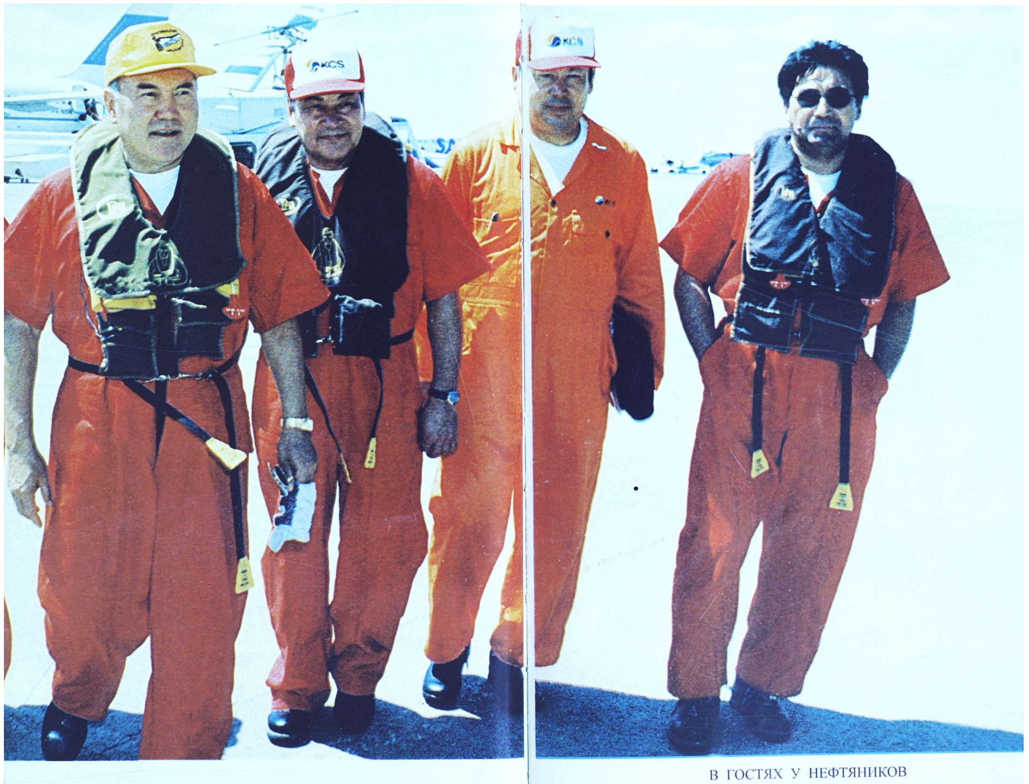
В ГОСТЯХ У НЕФТЯНИКОВ