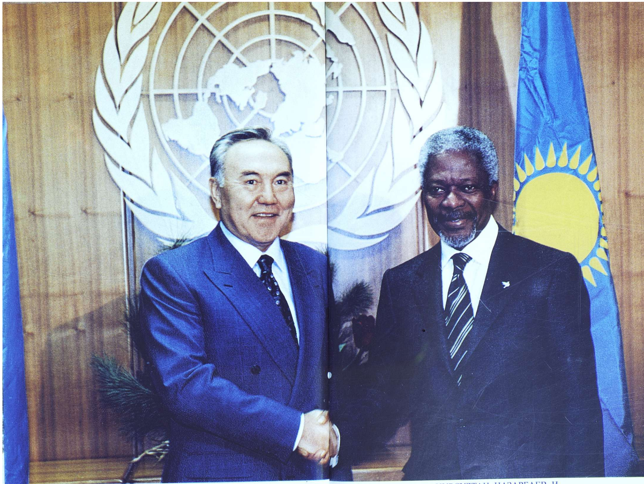
НУРСУЛТАН НАЗАРБАЕВ И ГЕНЕРАЛЬНЫЙ СЕКРЕТАРЬ ООН КОФИ АННАН