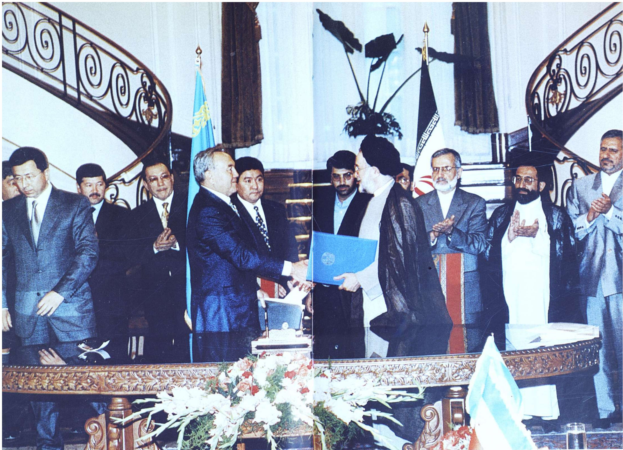
ТЕГЕРАН, 6 ОКТЯБРЯ 1999 Г.