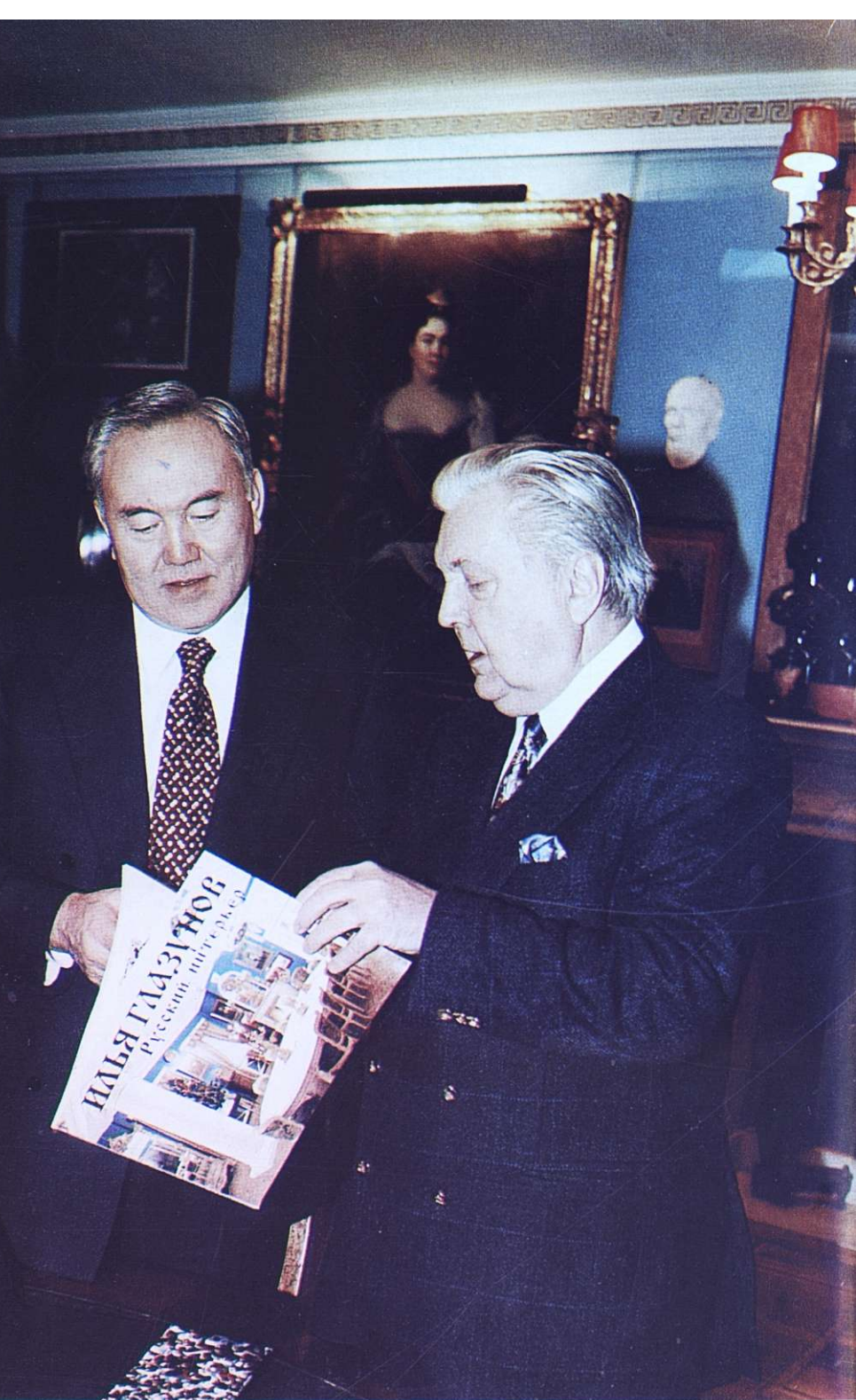
С ХУДОЖНИКОМ И. ГЛАЗУНОВЫМ