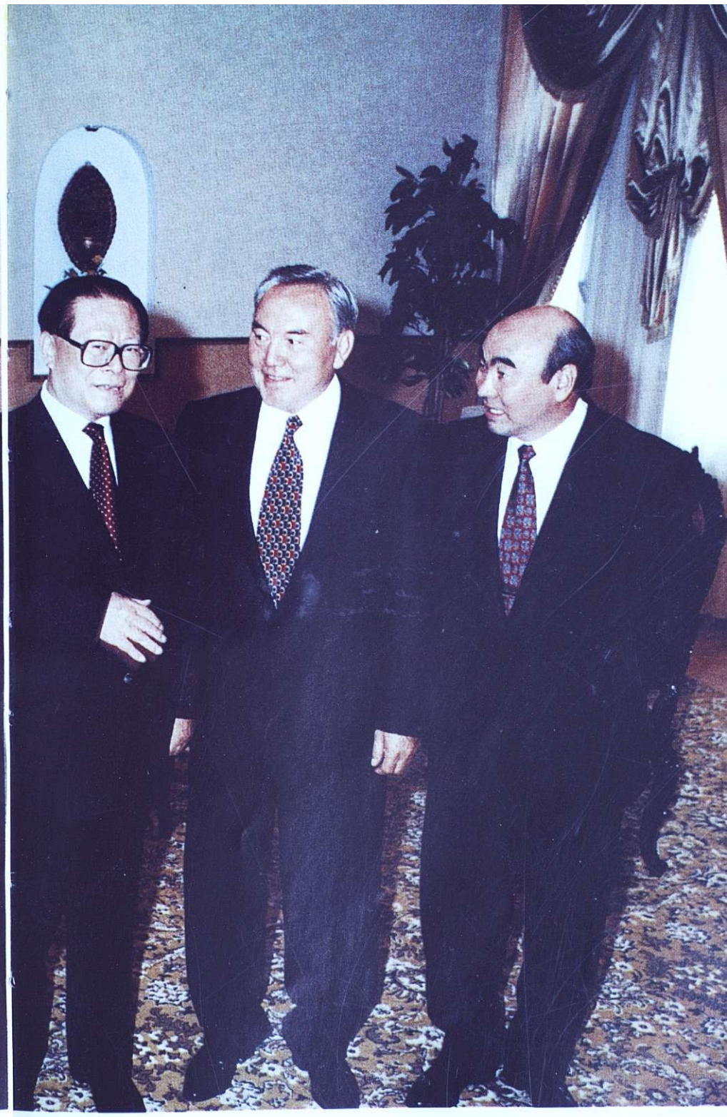
СОСЕДИ ДОЛЖНЫ ЖИТЬ ДРУЖНО