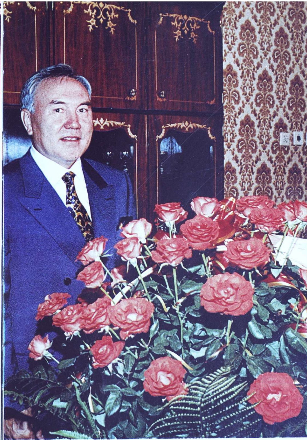
ЦВЕТЫ ДЛЯ ЦЗЯН ЦЗЭМИНЯ