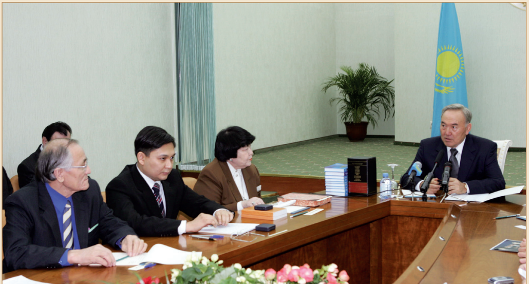
Ресей Федерациясындағы қазақ диаспорасының өкілдерімен жүздесу. Мәскеу қаласы, 2005 жылғы 17 қаңтар