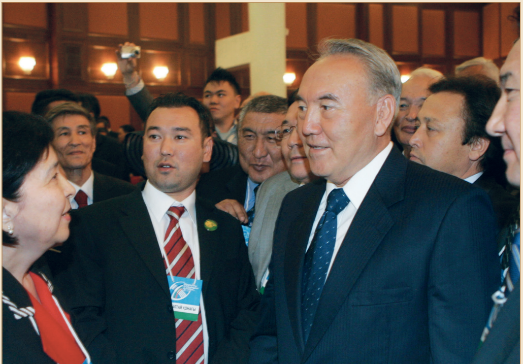
III құрылтай қонақтары арасында. Астана қаласы, 2005 жылғы 29 қыркүйек