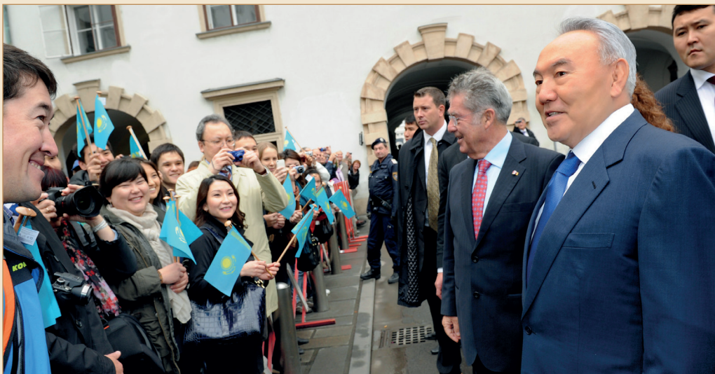
Сонау Австрияда тұрып жатқан осыншама қандастарыңды көргенде өзіңді бір сәт өз еліңде жүргендей сезініп қалатының бар. Вена қаласы, 2012 жылғы 21 қазан