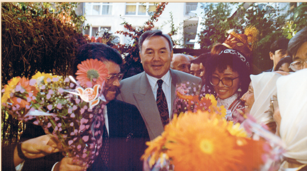
Құшақ толы гүл, жадыраған көңіл. Түркия Республикасының Президенті Тұрғыт Озалмен бірге еліміздің Түркиядағы елшілігінің ашылу салтанаты рәсімінде. Анкара қаласы, 1992 жылғы 29 қазан