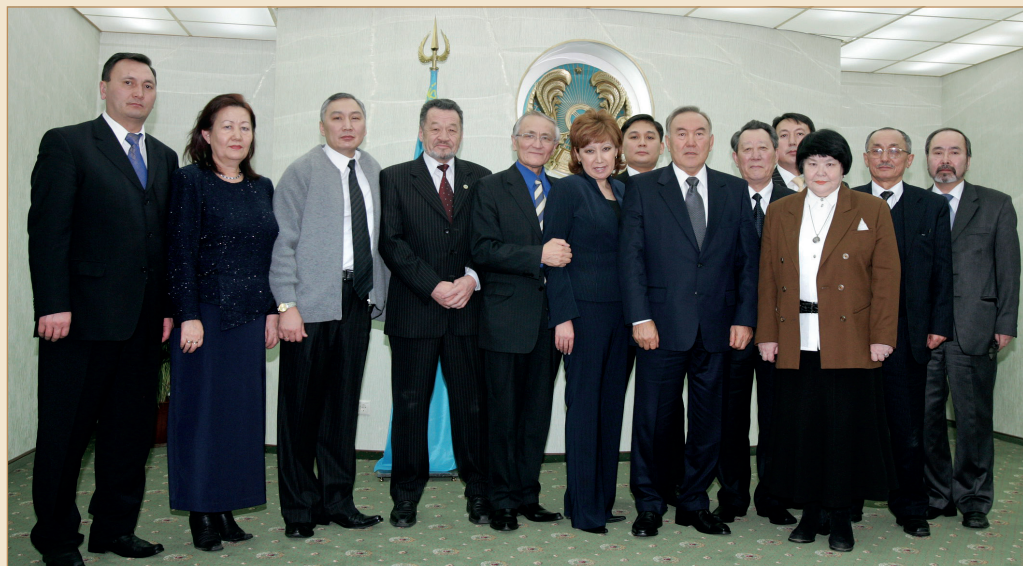
Кездесудің соңы әдеттегідей осылайша естелік суретке түсумен жалғасын тауып жатады. Мәскеу қаласы, 2005 жылғы 17 қаңтар