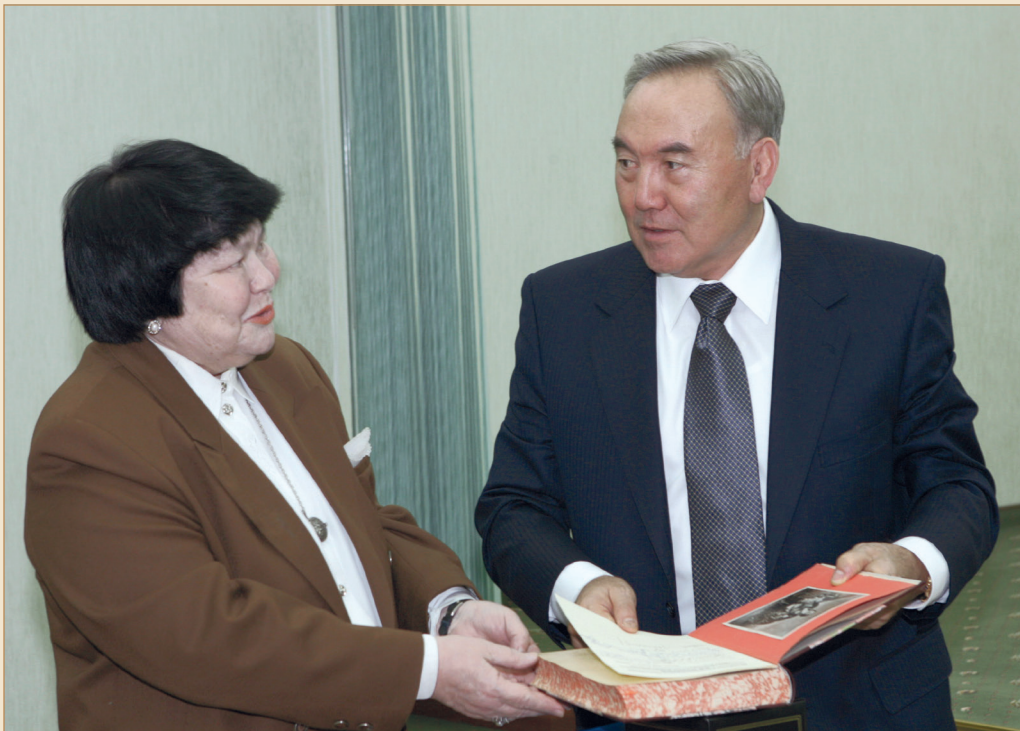
Қолтаңба жазып беретін кездер де болады. Мәскеу қаласы, 2005 жылғы 17 қаңтар