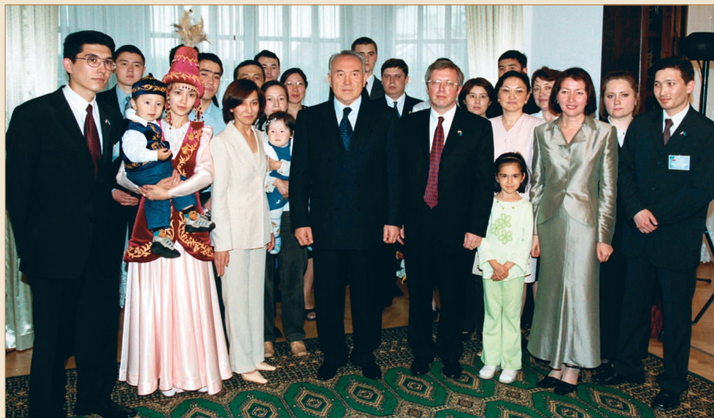
Еліміздің Польша Республикасындағы елшілігінің ашылу салтанаты. Қазақ диаспорасы өкілдерінің арасында. Варшава қаласы, 2002 жылғы 24 сәуір