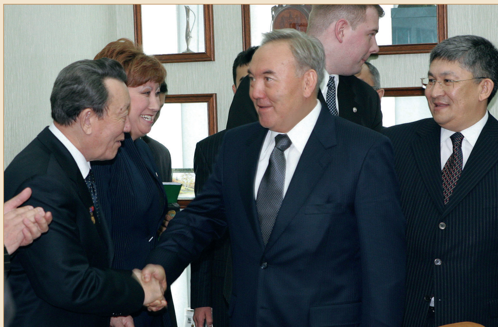
Жүздесу кезінде айтылар әңгіме, еске алар жайттар аз емес... Мәскеу қаласы, 2005 жылғы 17 қаңтар