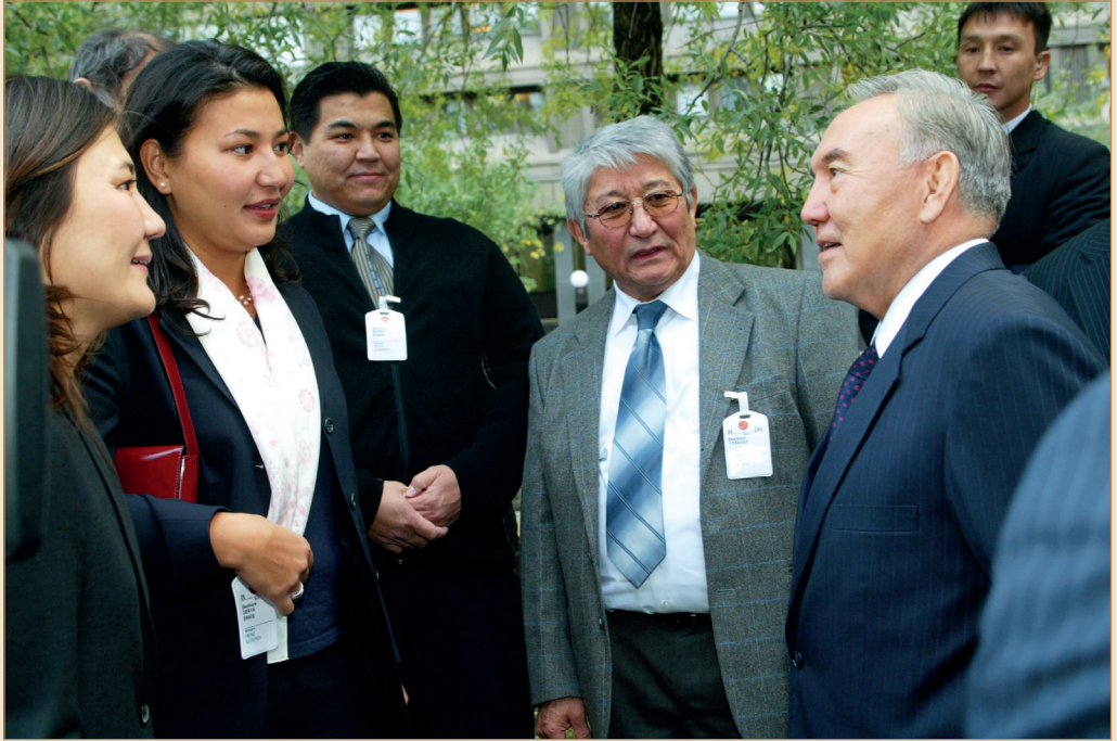
Швеция Корольдігіндегі қазақ диаспорасының өкілдерімен кездесу. Стокгольм қаласы, 2004 жылғы 25 қазан