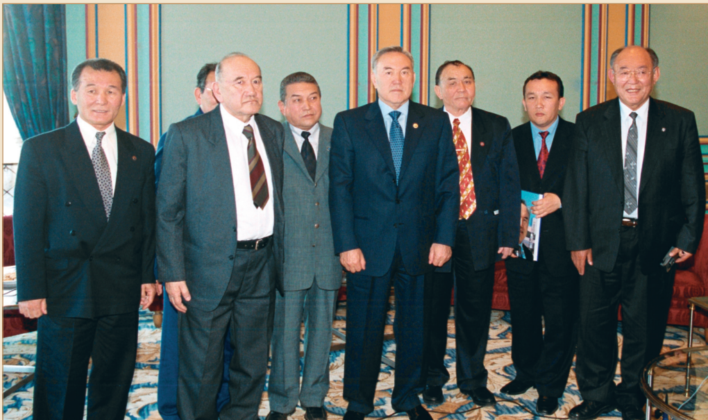
Бұл сәт – енді тарих! Түркі тілдес мемлекеттердің VII саммиті кезінде Түркиядағы қазақ диаспорасының өкілдері ортасында. Ыстамбұл қаласы, 2001 жылғы 25 сәуір