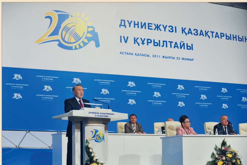
IV құрылтай делегаттары алдында. Астана қаласы, Тәуелсіздік сарайы, 2011 жылғы 25 мамыр