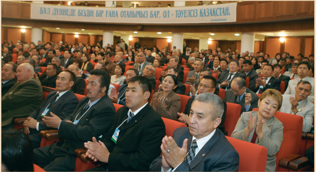
III құрылтай залынан көрініс. Астана қаласы, 2005 жылғы 29 қыркүйек