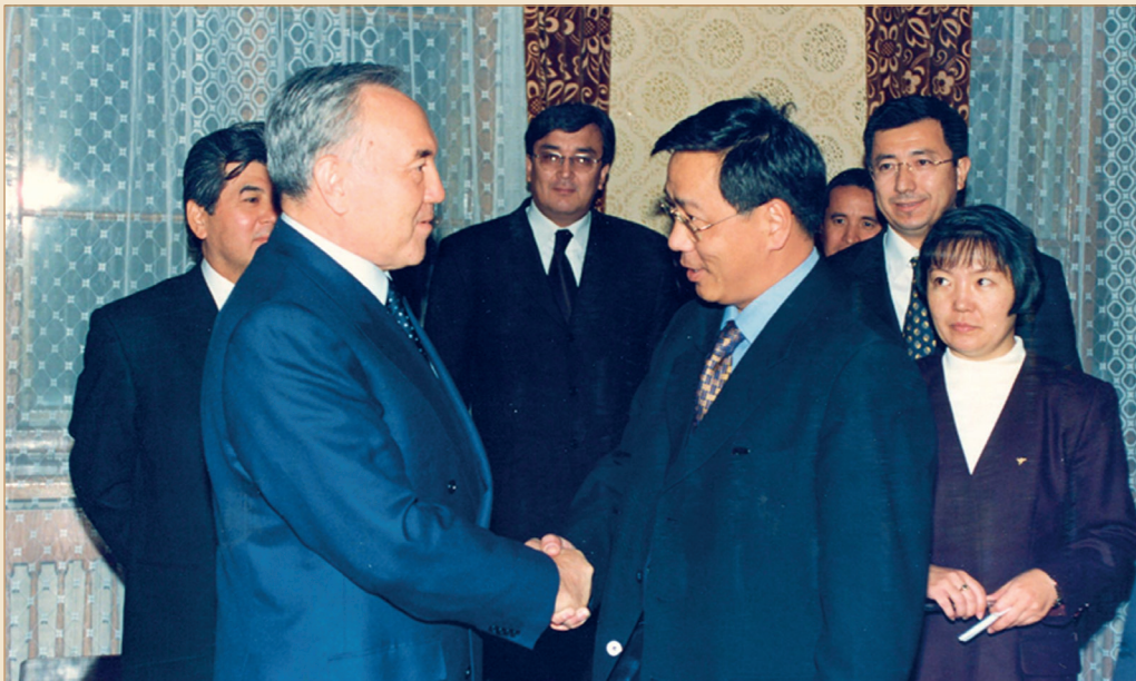
Моңғолиядағы қазақ диаспорасының өкілдерімен жүздесу сәті. Ұлан-Батыр қаласы, 1999 жылғы 23 қараша