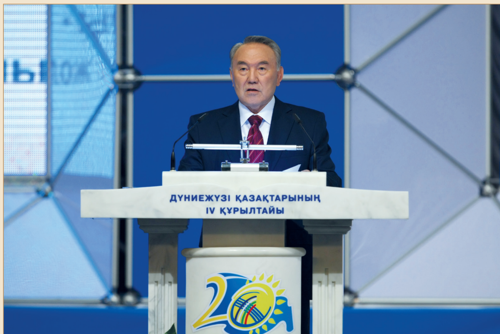
Ағайынмен бөлісер ой аз емес... Астана қаласы, Тәуелсіздік сарайы, 2011 жылғы 25 мамыр