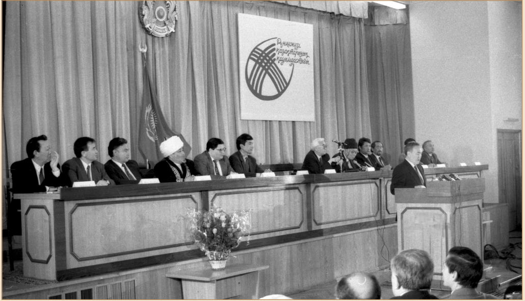
Дүниежүзі қазақтары I құрылтайының мінберінде. Алматы қаласы, Республика сарайы, 1992 жылғы 30 қыркүйек