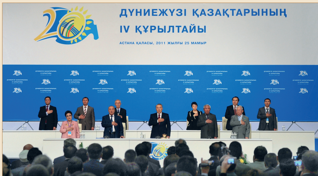
Дүниежүзі қазақтары IV құрылтайының ашылу сәті. Астана қаласы, Тәуелсіздік сарайы, 2011 жылғы 25 мамыр