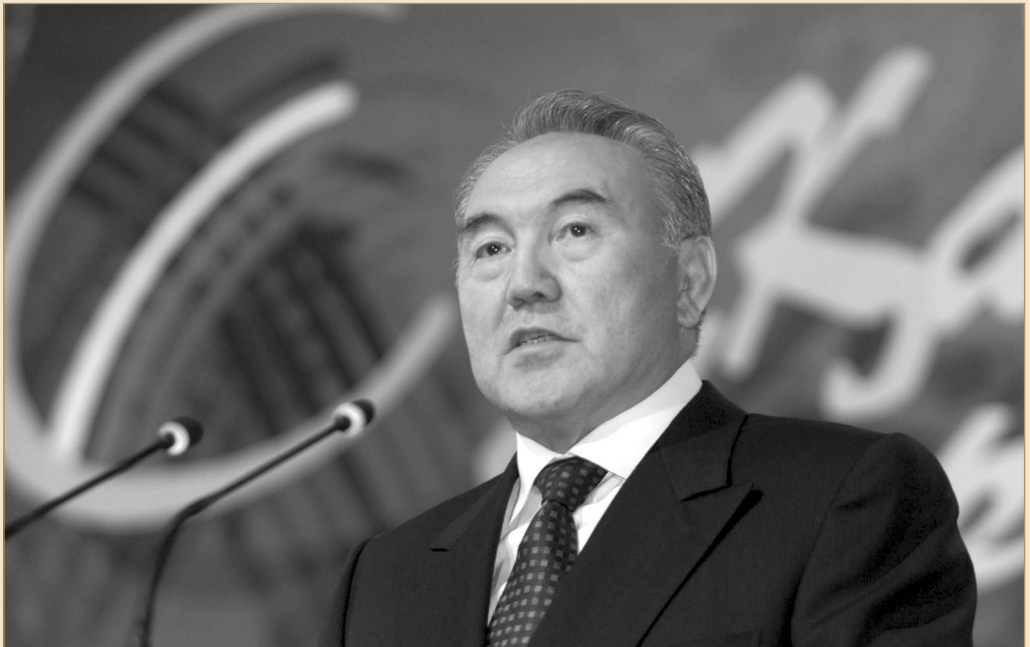
Дүниежүзі қазақтарының II құрылтайында. Түркістан қаласы, 2002 жылғы 23 қазан