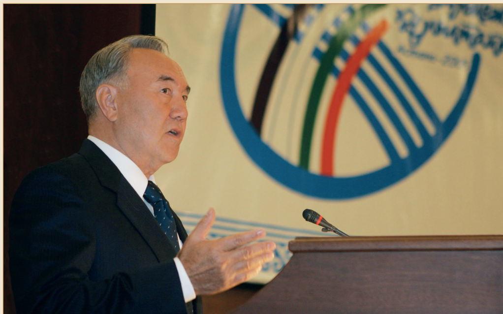
Дүниежүзі қазақтарының III құрылтайында. Астана қаласы, 2005 жылғы 29 қыркүйек