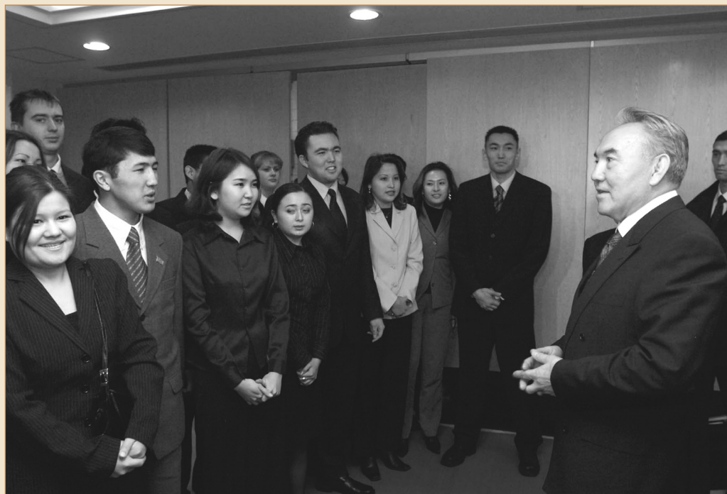
Бейжің университетінде оқитын қазақ жастарымен дидарласу. Қытай Халық Республикасы, Бейжің қаласы, 2002 жылғы 24 желтоқсан