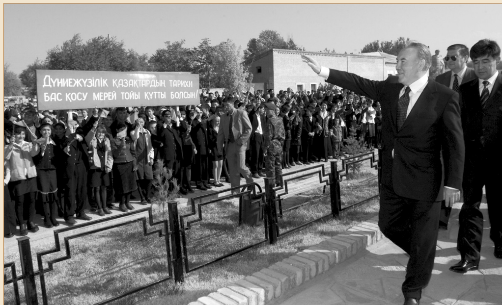
Дүниежүзі қазақтарының II құрылтайына келген делегация мүшелерімен бірге көне Түркістан жұртшылығы алдында. Түркістан қаласы, 2002 жылғы 23 қазан