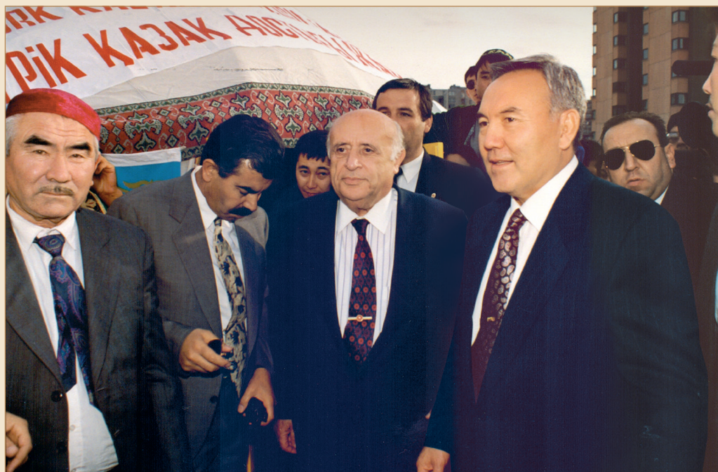
Түркия Президенті Сүлеймен Демирелмен бірге. Түркия Республикасының 75 жылдық мерейтойын мерекелеу кезінде қазақ диаспорасы өкілдерінің арасында. Анкара қаласы, 1998 жылғы 29 қазан