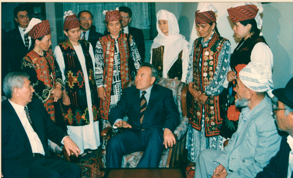
Иран Ислам Республикасындағы қазақ диаспорасының өкілдерімен кездесу. Тегеран қаласы, 1996 жылғы 12 мамыр